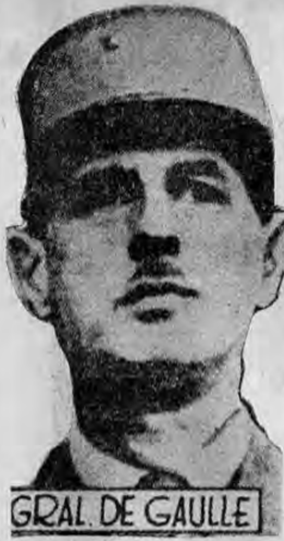
GRAL. DE GAULLE

nes de Francia y del mundo en-nos innumerables que cente-tero y me consta por testimo-nas de millares de otros arden