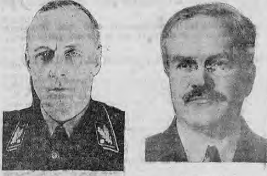
VON RIBBENTROP, factor alemán de la entente nazi - comunista MOLOTOV, factor ruso de la entente entre Berlín y Moscú